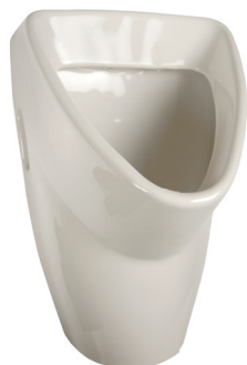
SLP 31 - LIVO